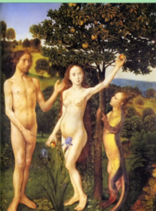
Адам, Ева и Лилит. Гравюра XV век