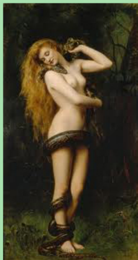
Джон Кольер, Лилит