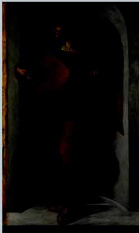
Рис. 7. Припи- сыва- ется Леонар- до да Винчи. Ангел в крас- ном с лют- ней. 1490 г.