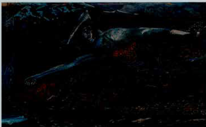
Рис. 9. Михаил Врубель. Демон поверженный. 1901 г.

знаком уравнительной казарменной китайщины. (Рис. 9, 10)