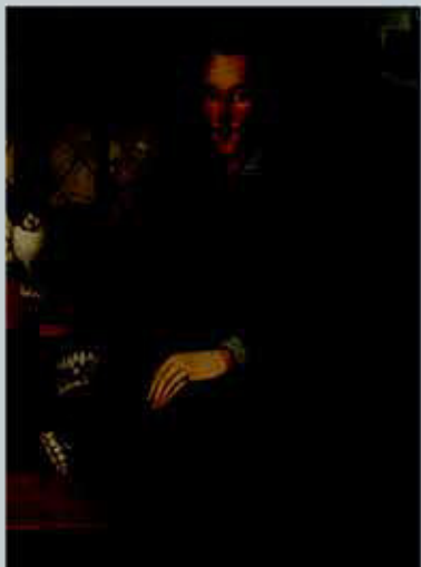
Рис. 2. Джон де Критс. Мелан- холик с чёрным котом. 1603 г.

цветного стёклышка, куска священнодейственно окрашенной ткани. Уменьшилось значение существенных цветовых символов. Зато появилось множество названий, оттенков, увязанных с мелочами природного и вещного мира: розовый , салатовый , апельсиновый , цвет вороньего крыла, бутылочный , шоколадный , брусничный .