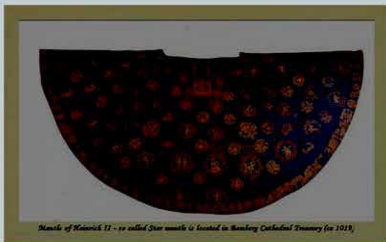
Рис. 10. Мантия германского императора Генриха II, представляет собой карту звёздного неба

Зелёный стал символом растений, кормильцев земли, зелёной планеты. Отсюда символика зелёного , как цвета обновления. У древних египтян он был символом силы, оживляющий мёртвое,