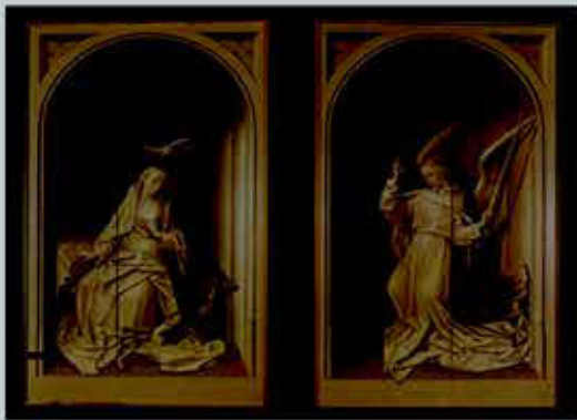
Рис. 4. Хуго ван дер Гоес. Ангел Благовещения. 1479 г.

король Генрих IV, оплакивая своих фавориток, носил чёрный костюм, вышитый серебряными слезами, черепами и потухшими факелами, что говорило о крайней степени горя. Но не всегда тоску, печаль и оттенки этих чувств выражали только чёрным . Тут мог быть тёмно-коричневый , символизирующий отчаяние, отречение от мира, вечность; серый — печаль, смирение, уныние; лиловый — страдание, отрешённость, созерцание, холодность. В то же время в русской