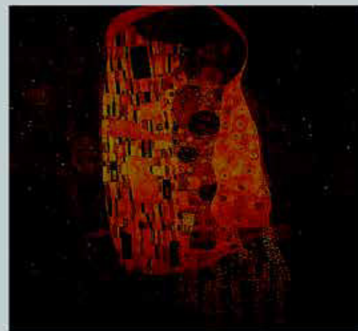
Рис. 5. Густав Климт. Поцелуй. 1907-1908 гг.

Белый сделался символом животворных субстанций — молока, семени живых существ. Но