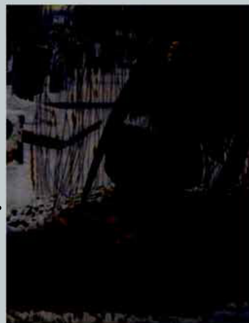
Рис. 3. Карлос Швейб. Упоко- ение смерти. 1895- 1900 гг.

Чтобы понимать все тонкости символизма цвета, надо было обладать даром «слушать глазами», о чём Шекспир говорит столь часто в своих произведениях. Англичане того времени обладали развитым цветовым восприятием природного мира, утончённостью подбора красок в мире вещном. Среди тех названий, что можно увязать с цветами, существующими в наше время, равноправно существуют: «цвет трубочиста», «цвет короля», «цвет потерянного времени», «цвет мёртвых листьев».