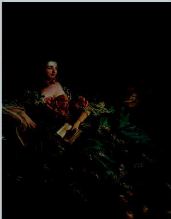
Рис. 11. Франсуа Буше. Мадам Помпадур

Зелёный стал символом растений, кормильцев земли, зелёной планеты. Отсюда символика зелёного , как цвета обновления. У древних египтян он был символом силы, оживляющий мёртвое,