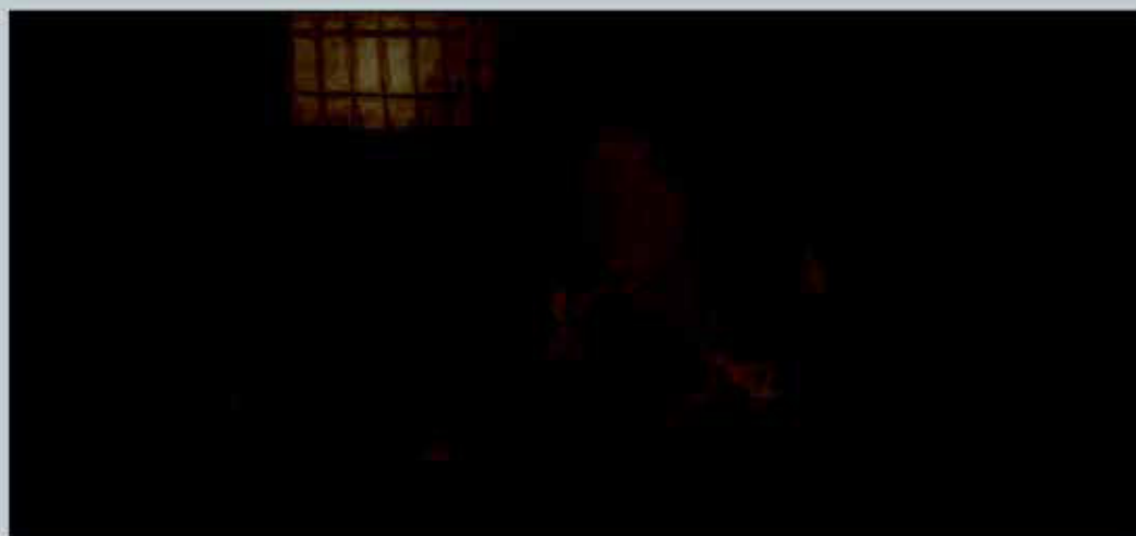
Рис. 6. Франсиско Гойя. Дом умали- шённых. 1819 г.

димо, такое восприятие чистого жёлтого цвета не изменилось со времён Ренессанса, где он означал вызов. В ренессансном английском цветовом коде положительным знаком среди жёлтых были отмечены все золотистые цвета («цвет согласия», «цвет ржи») и само золото. Золото испокон веков символизировало: сияние, благодать, славу, просвещение, мудрость, милость, избранность. Во всех же остальных случаях, как в бытовой традиции, так и в символике цвета - оттенки жёлтого означали, как правило, вещи отрицательные или смешные. И безумие, сумасшествие