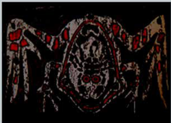
Рис. 1. Роспись. Новая Гвинея

Разросшийся мир вещей снизил драгоценность