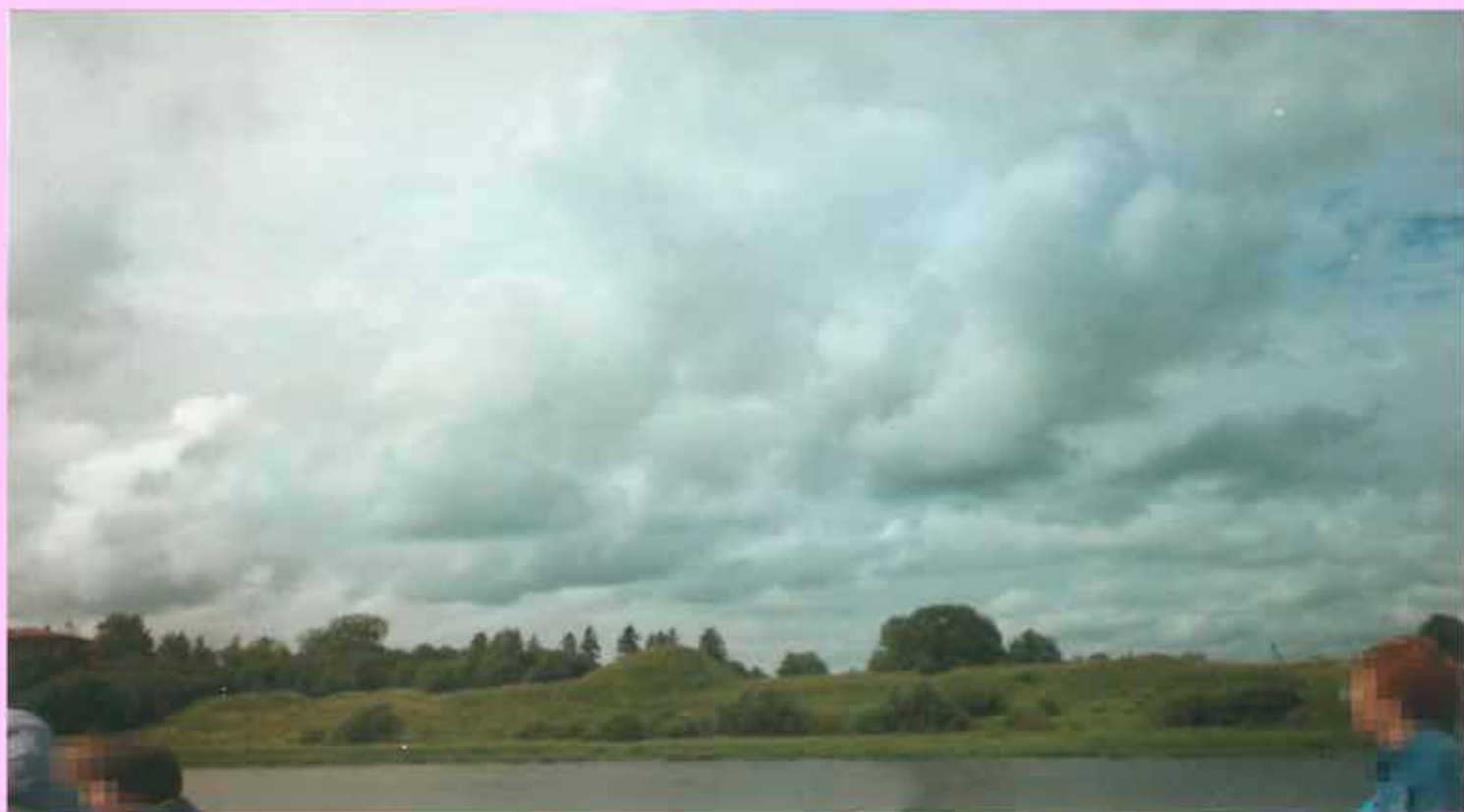
Фото 1. Курган на берегу реки Волхов

Так же практиковались захоронения в курганах (Фото 1). То есть хоронили прах в горшке, а над ним насыпали курган. Археологи находят в таких